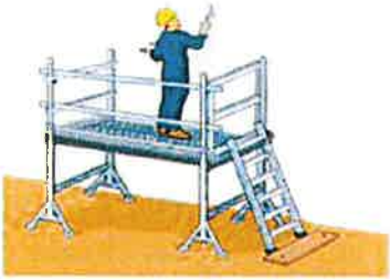
Travaux intérieur = plateforme stabilisée et protégée