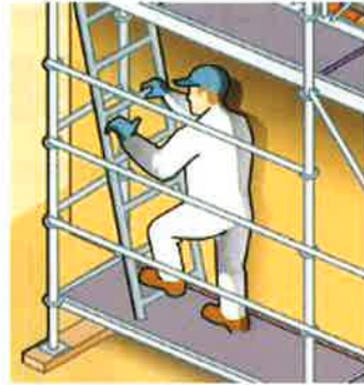
Travaux sur façade = échafaudage vérifié et sécurisé