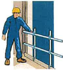
Ouverture sur le vide = garde-corps temporaire

Travailler en hauteur peut occasionner des chutes : c'est la première cause d'accidents du travail mortels dans le secteur du bâtiment.