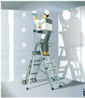
Travaux ponctuels = plateforme individuelle